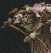
Red Mustard Cress